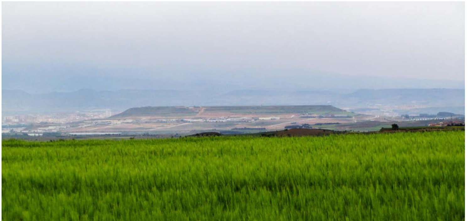
“Pöytävuoria” näkyi pohjoisessa.

Alla Vienan keskustan katu Calle de Primo de Rivera. Oikealle jää Santa Marian kirkko, joka on peräisin 1200 luvulta. Vasemmalla näkyy muutama pöytä baarin ulkopuolella. Tätä seuraavaan baariin poikkesin kahville ja boccadillolle. Yksi ulkopöytä oli vapaana, muitakin vaeltajia oli viettämässä lepoa. Kirkon vieressä olevalla aukiolla arkaadien alla oli menossa jokinlaiset kukkamarkkinat.