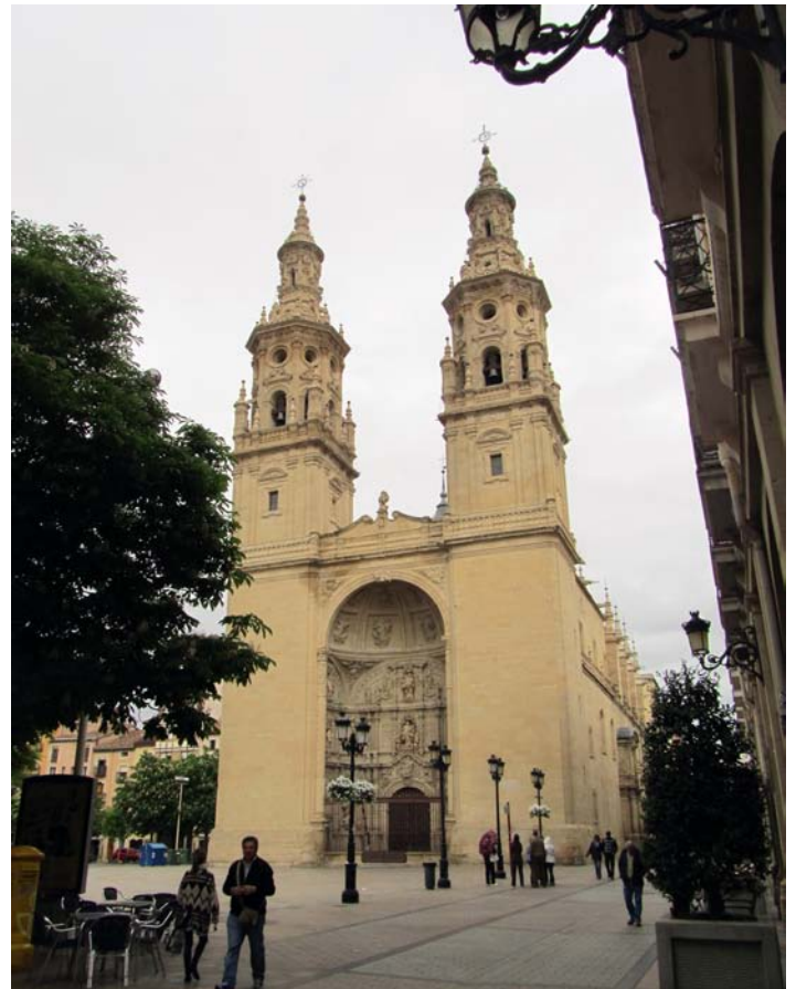
Concatedral de Santa Maria de la Redonda