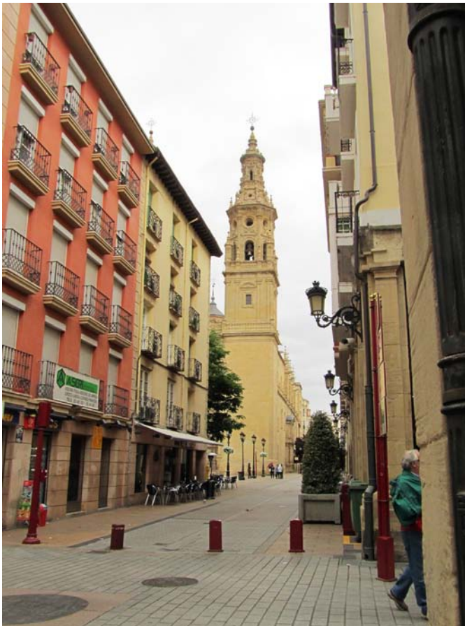
Iglesia de Santa Maria de Palacio