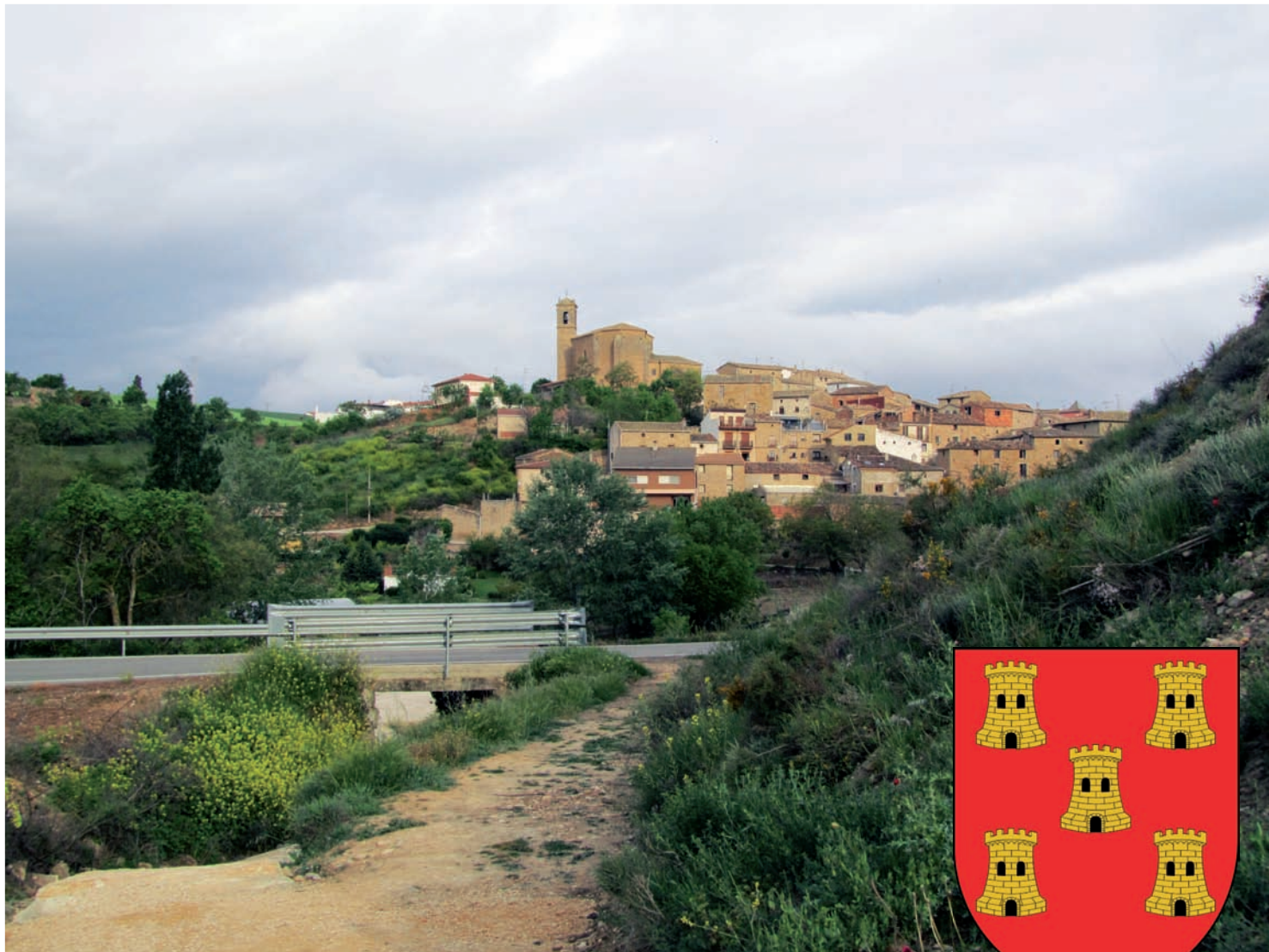
Torres del Rion kylän kirkko Parroquial de San Andres näkyi kukkulan korkeimmalla kohdalla. Lähikuva tornista alla oikealla. Kylässä oli myös toinen kirkko Iglesia del Santo Sepulcro (alla vas).