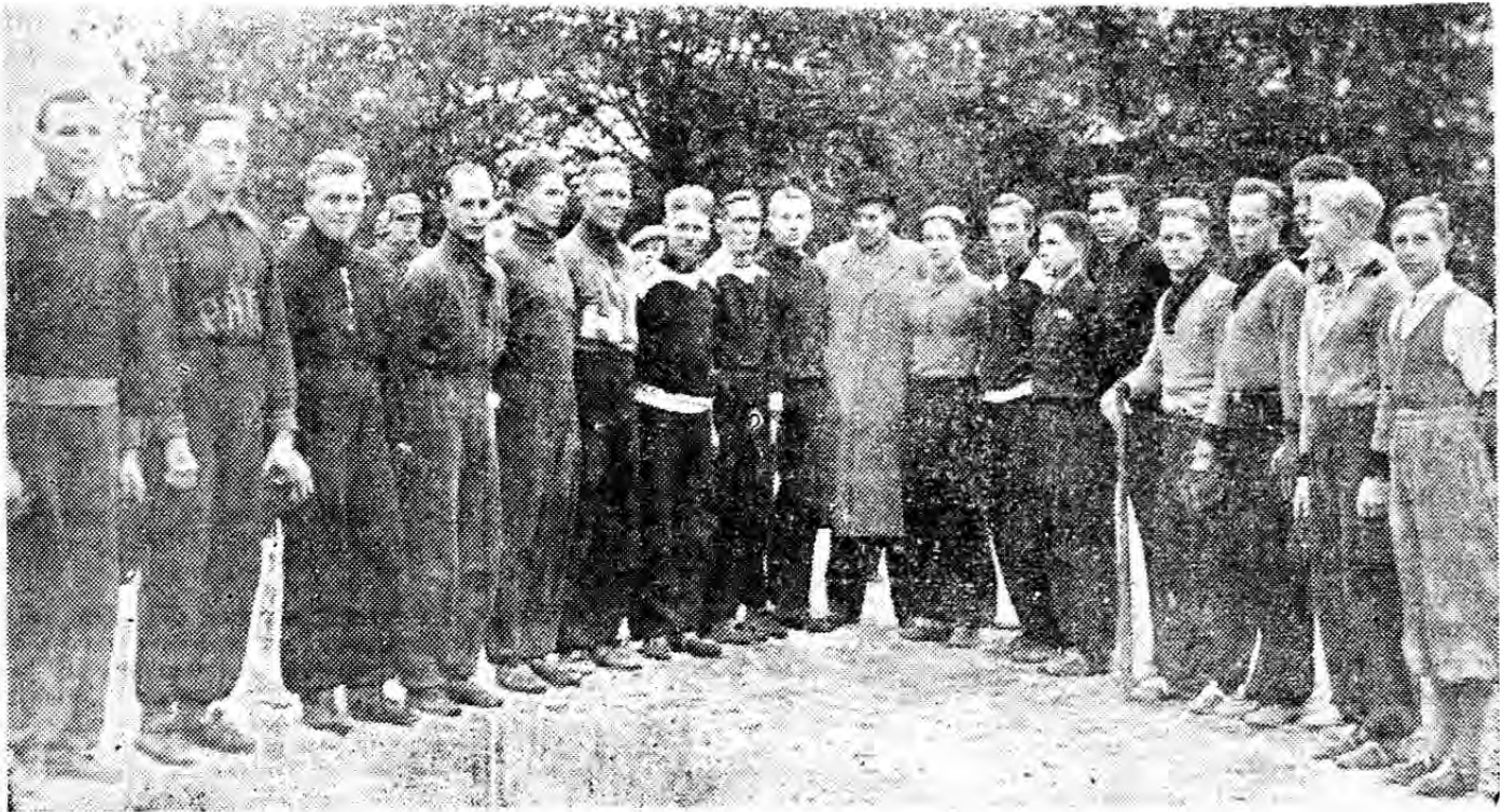
Porin Rykmentin ja Turun NMKY:n miesjoukkueet källassa.