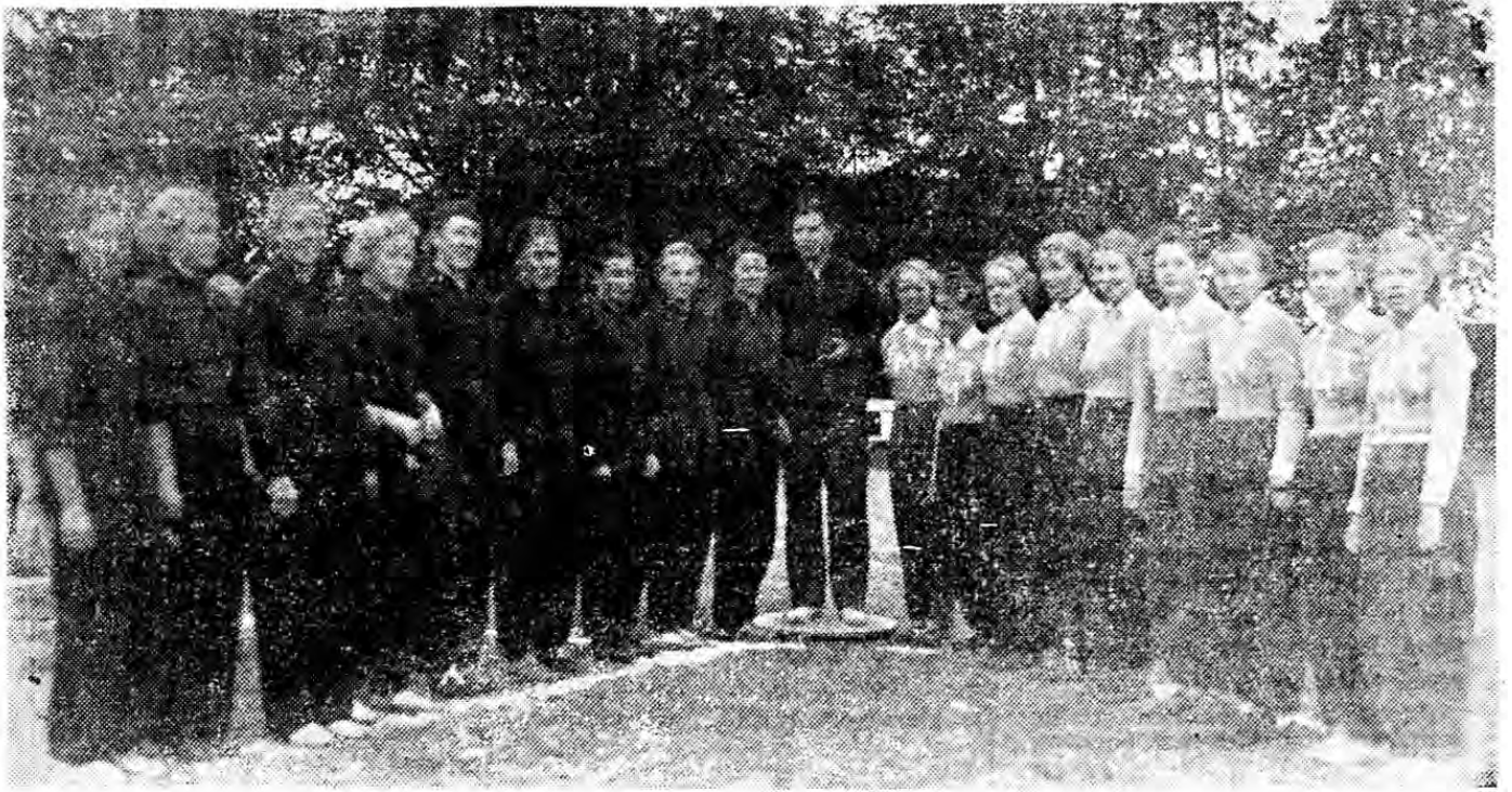
Naisten ottelun terhakkaat pelaajattaret. Vasemmalla Salon, oikealla Turun yhdeksiköt.