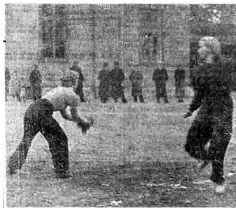
Pelaajatar ehtii pesulle ennen kuin pallo. Hauska tilannekuva naisten ottelusta.